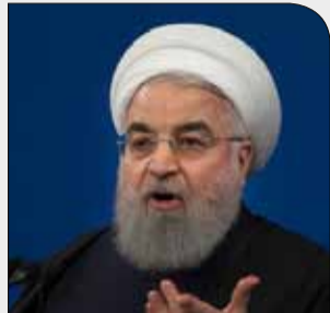
دادستان کل کشور مطرح کرد

سه‌شنبه ۲۵ دی ۱۳۹۷ • سال دوم • شماره ۳۲۹ • ۸ صفحه • ۱۰۰۰ تومان