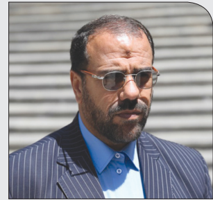
معاون پارلمانی رئیس جمهور:

پنجشنبه ۱۳ دی ۱۳۹۷ • سال دوم • شماره ۳۱۹ • ۸ صفحه • ۱۰۰۰ تومان