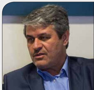
«تاجگردون» بودجه ۹۸ را تشریح کرد