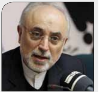
صالحی خطاب به اروپا:

قبل از آنکه دیر شود، به قول خود عمل کنید