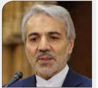
نویخت اعلام کرد:

رشد ۳۸ درصدی توسعه انسانی کشور در ۱۷ سال گذشته