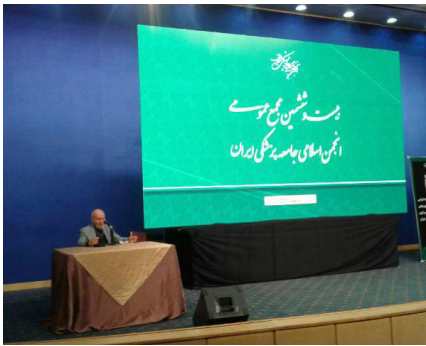
بودیم و روابط ما با دنیا قطع بود.

معاون نخست وزیر در امور اجرایی در دهه شصت، خاطر نشان کرد، بعد از استقرار دولت روحانی، امید ما به ترمیم روابط خارجی و حل گره هسته ای و سیاسی با دنیا بود که البته دولت و به ویژه وزارت امور خارجه با عملکرد خوبی که داشت همه ما را امیدوار کرد و توانست یکی از پیچیده ترین و پر افتخار ترین مذاکرات را مدیریت و به نتیجه برساند.