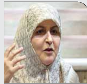
نماینده مجلس تهران:

پنجشنبه ۶ دی ۱۳۹۷ • سال دوم • شماره ۳۱۳ • ۸ صفحه • ۱۰۰۰ تومان