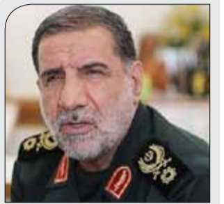
جانشین قرارگاه ثارالله سپاه:

توسعه اقتصادی در سایه امنیت ایجاد می شود