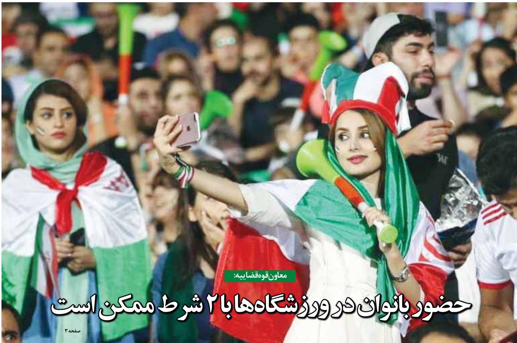
معاون قوه قضاییه:

حضور بانوان در ورزشگاه‌ها با ۲ شرط ممکن است