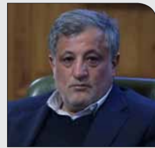
رئیس شورای شهر تهران:

دوشنبه ۳ دی ۱۳۹۷ سال دوم شماره ۳۱۰ ۸ صفحه ۱۰۰۰ تومان