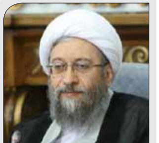
رئیس قوه قضاییه:

دشمن به دنبال ایجاد شکاف میان مردم و مسئولان است