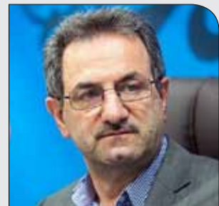
استاندار تهران خبر داد

سه‌شنبه ۳ دی ۱۳۹۷ • سال دوم • شماره ۳۱۱ • ۸ صفحه • ۱۰۰۰ تومان